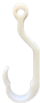
Haak enkel coaxiaal – 30800212