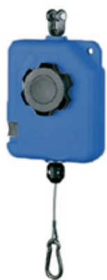
L-N Balancer – 30800210

Iedere katrol wordt geleverd met een katrolhaak voor een cirkel systeem óf een katrolhaak voor een coaxiaal systeem.