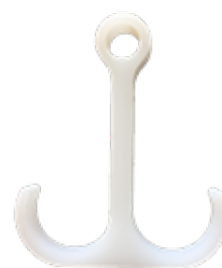
Haak dubbel cirkel - 30800213

Wilt u meer informatie of uw medewerkers kosteloos trainen? Neem contact op met het Customer Service Team van MC Europe. Ze helpen u graag verder!