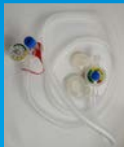
Neo Tee® in-line