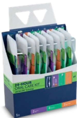
AVANOS + Oral Care Kit - q4