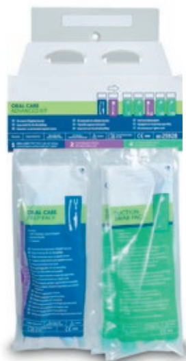
AVANOS + Oral Care Advanced Kit