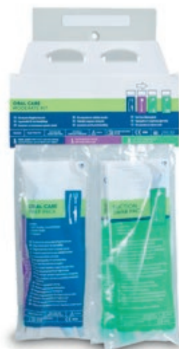
AVANOS + Oral Care Moderate Kit